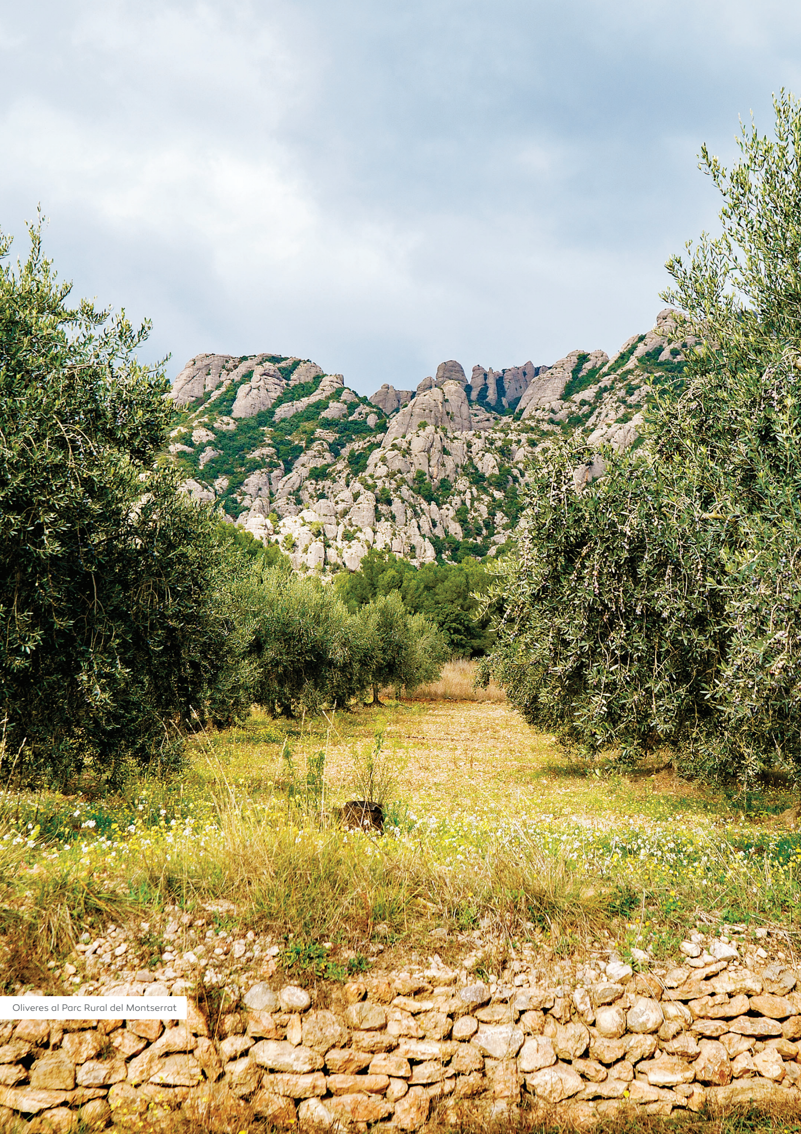
Oliveres al Parc Rural del Montserrat